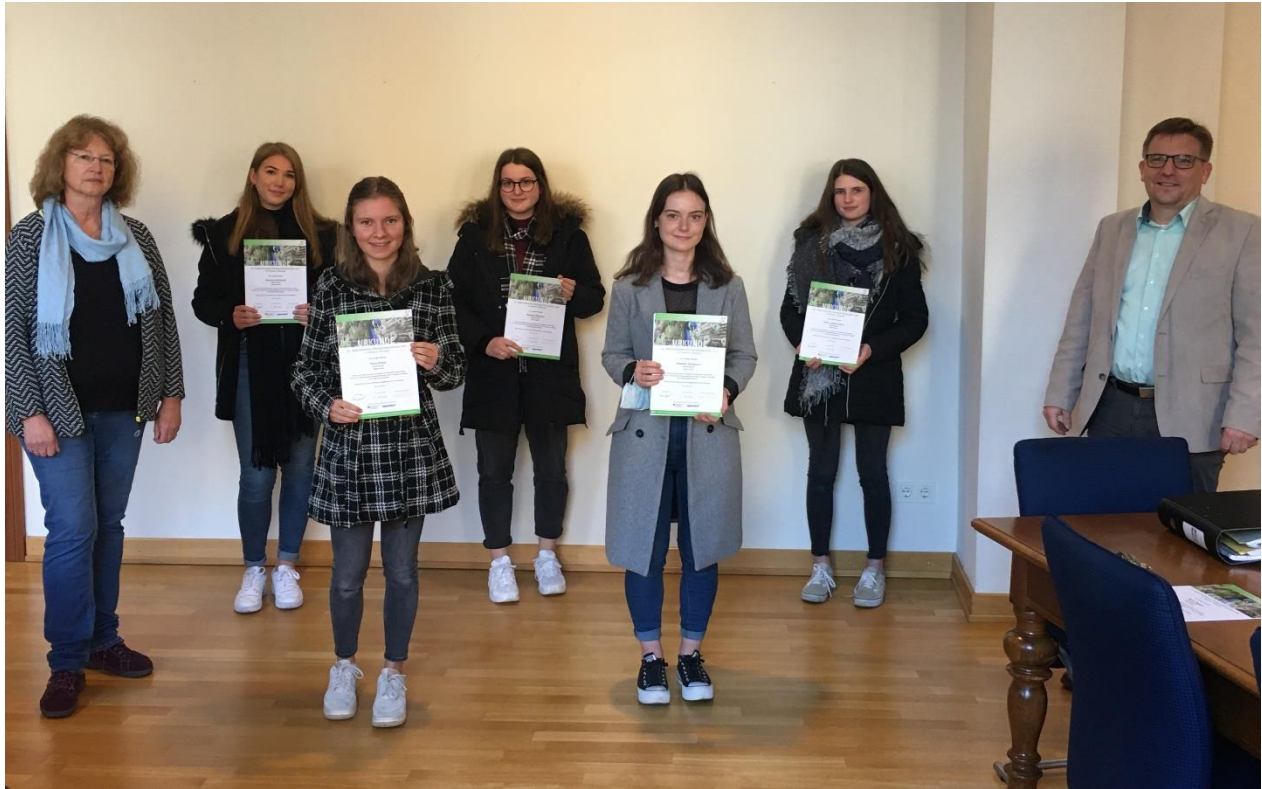
Urkundenüberreichung an die Teilnehmerinnen der diesjährigen BiologieOlympiade (Es fehlt Maria Tzeggai)