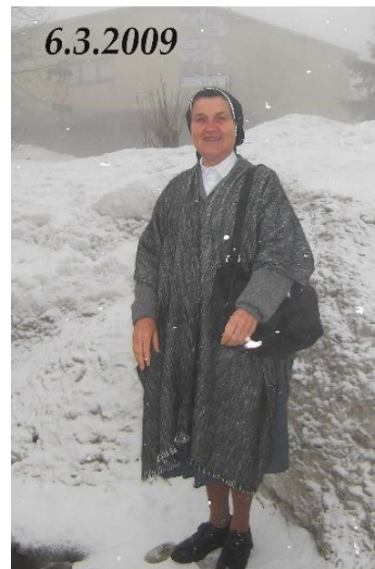
Der erste Schnee ihres Lebens