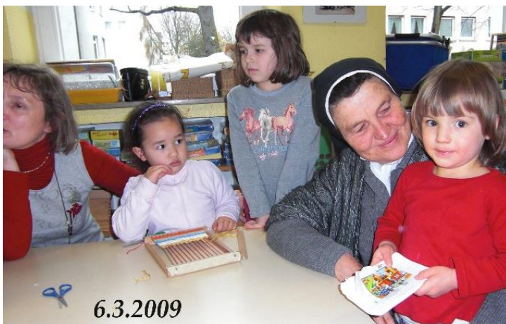
Besuch im Kindergarten