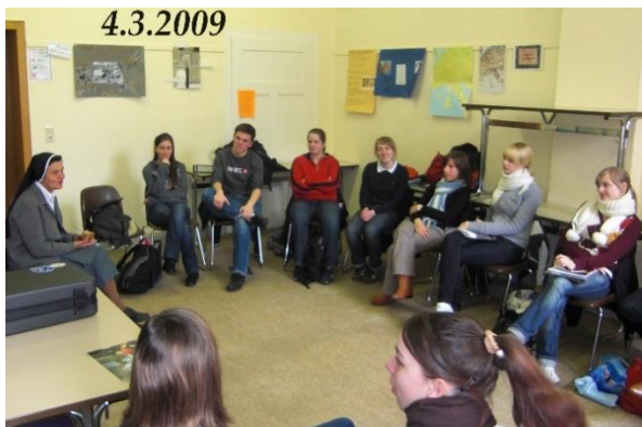
Im Gespräch mit dem Spanischkurs Jgst. 13