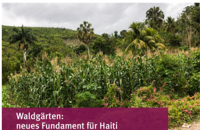
Waldgärten: neues Fundament für Haiti

„Heute für Morgen – Wir setzen ein Zeichen ... ... in Haiti und Äthiopien“